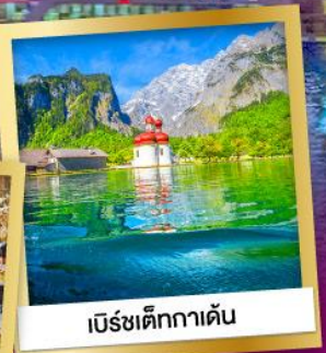
เบิร์ชเต็กกาเดิน