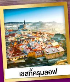
เชสท์ครุมลอฟ