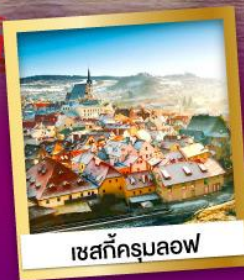
เชกที่ครุมลอฟ