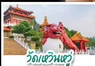
วัดเหวินหู