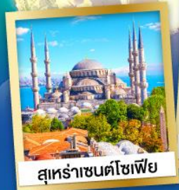
สุหร่าชนคัโซเฟีย