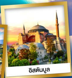
อิสตันบูล