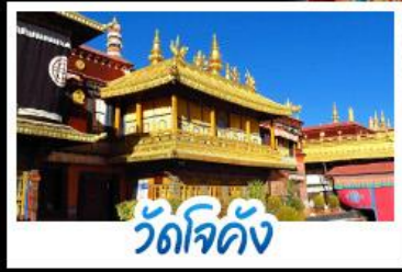
วัดโจคัง