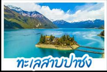
ทะเลสาบปาซง