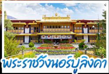
พระราชวังนอร์บูลิงคา