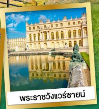
พระราชวังแวร์ซายน์