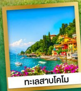
ทะเลสาบโคโม