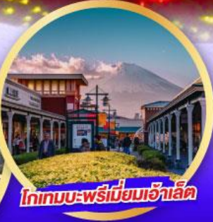
โกเทมบะ-พรีเมียมเอ้าเล็ท