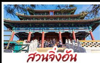
สวนจิ้งอับ