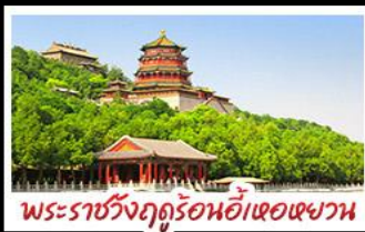
พระราชวังฤดูร้อนอู่เทอหยวน

ทำแพนเมืองจีนด่านจวียงกวน - พระราชวังฤดูร้อนอู่เทอหยวน สวนจิ้งอับ - วัดลามะ - โมลงร้านช้อปปิ้ง - โรงแรม 4 ดาว มื้อพิเศษ เปิดปักกิ่ง สุกี่มองโก MICHELIN GUIDE ร้าน TAO TAO JU