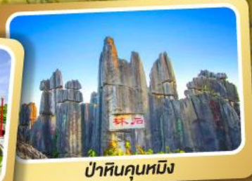
ป่าหินคุณหมิง