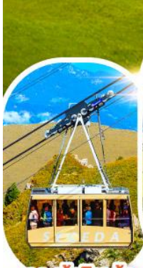
กระเช้าซีเคด้า