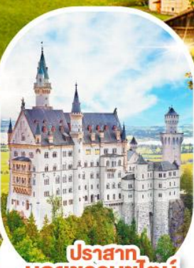
ปราสาท นอยชวานชไตน์