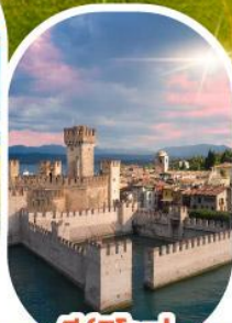
ซีรัมิโอเน

เดินทาง 28 เม.ย.- 04 พ.ค. 68 30 พ.ค. - 05 มิ.ย. 68 11-17 มิ.ย. 68