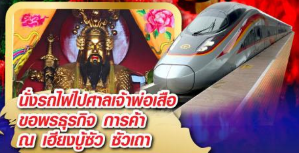
นั่งรถไฟไปศาลเจ้าพ่อเสือ ขอพรธุรกิจ การค้า ณ เชียงบู๊ซัว ช่วงเวลา