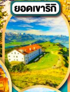
ยอดเขาริกิ