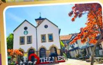
เทมส์ทาวน์