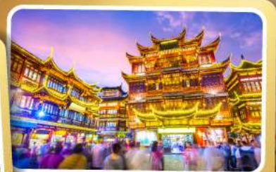
ตลาดร้อยปีเฉิงหวงเหมียว

สนุกสุดมันส์ไปกับเครื่องเล่น Shanghai Disneyland เต็มวัน