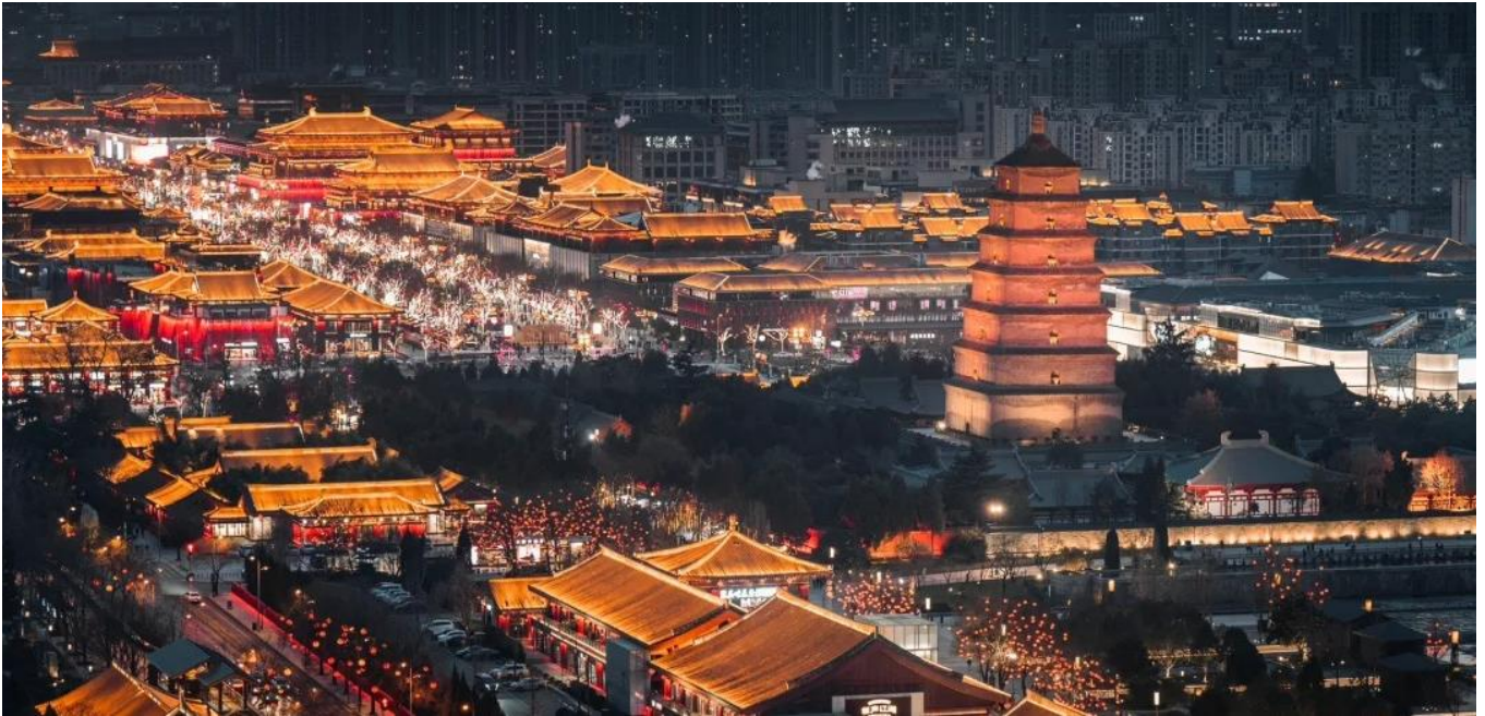
ค่ำ รับประทานอาหารค่ำ ณ ภัตตาคาร (มื้อที่ 12)

सानซี ตั้งอยู่ในหุบเขาที่มีแม่น้ำเว่ยไหลผ่าน มีประวัติศาสตร์ยาวนานกว่า 3,000 ปี ได้ถูกสถาปนาเป็นราชธานีในนาม “นครฉางอาน” เคยเป็นนครหลวงในสมัยต่างๆ รวมทั้งสิ้น 13 ราชวงศ์ ซื่ออันได้เป็นศูนย์กลางการติดต่อทางเศรษฐกิจและวัฒนธรรมระหว่างจีนกับประเทศต่างๆ ทั่วโลก เป็นจุดเริ่มต้นของเส้นทางสายไหมอันเลื่องชื่อ มีโบราณสถานโบราณวัตถุเก่าแก่อันล้ำค่าและเป็นแหล่งท่องเที่ยวที่สำคัญของจีน นำท่านเข้าชม ถนนคนเดินต้าถิง แหล่งท่องเที่ยวสายไหม เสมือนถนนสายวัฒนธรรม ที่จะประดับสีเหลืองทองยามค่ำคืน ที่ซึ่งเหล่าวัยรุ่นจะมาสวมชุดฮั่นผู้กันเต็มทั้งพื้นที่ตลอดทั้งคืน นอกจากนั้นยังมีร้านค้าเครื่องประดับ ของกินของใช้ และกิจกรรมอีกมากมายให้ท่านได้สัมผัสกันอย่างเต็มอิ่ม