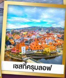
เซกิตซ์มุลเฟ