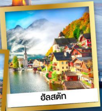
ออสเตรีย