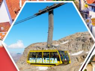
กระเช้าดิวาโวลูซซา