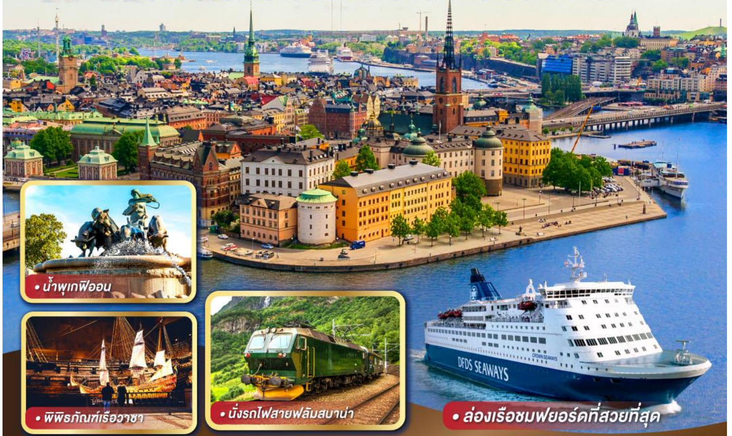
• น้ำพุเทพีออน