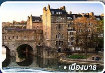
• เมืองบาร